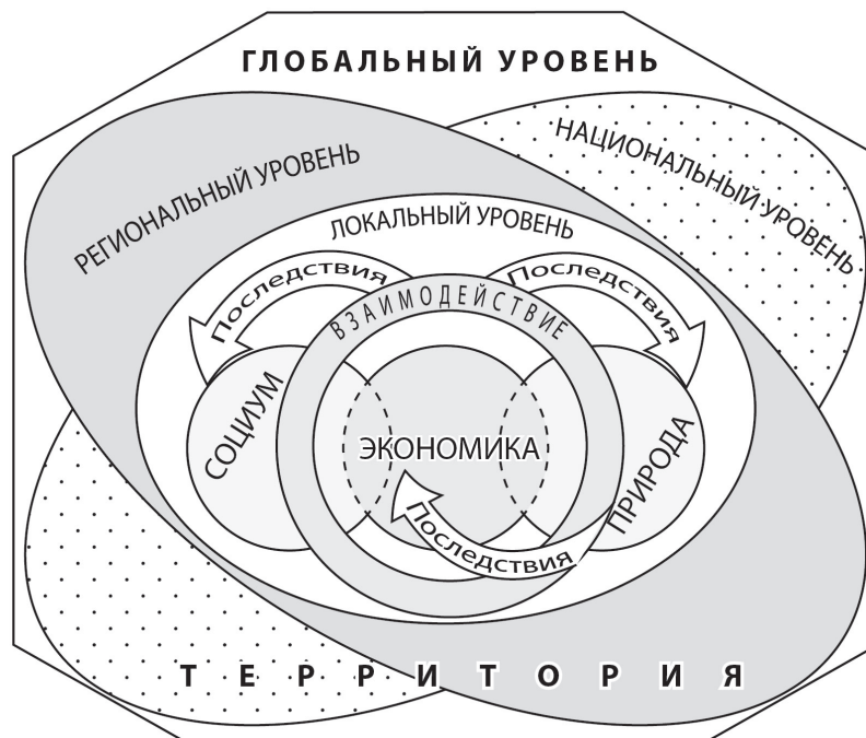
Рис. 2. Объектно-предметная сфера общественно-географических исследований

организации общества (рис. 2). Это характерно и для глобального уровня, и для социогеоосистем меньшего масштаба, т. е. в таком аспекте социогеоосистемы представляют собой мини-модели глобального социогеопространства, которое постоянно меняется под влиянием главного фактора преобразования окружающего мира – природопользования и его последствий . Именно в плоскости « взаимодействие – последствия » формируется предметная сфера общественной географии. Так, взаимодействие человека и природы, положенное в основу функционирования экономики, стало причиной серьезных противоречий и угрожающих последствий в жизнедеятельности общества.