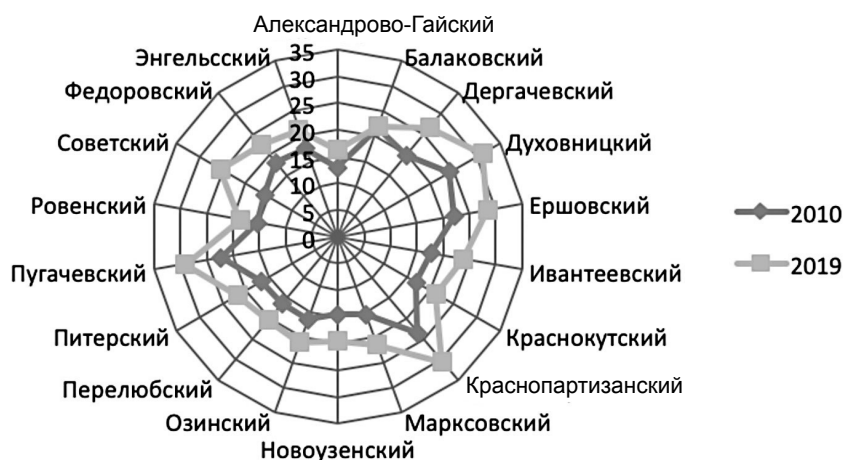
Рис. 2. Левобережье. Изменение доли лиц в возрасте 60 лет и старше в общей численности сельского населения за 2010–2019 гг. [4, 5]