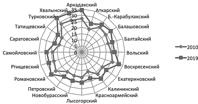
Рис. 3. Правобережье. Изменение доли лиц в возрасте 60 лет и старше в общей численности населения за 2010–2019 гг.

– рост демографической нагрузки на трудоспособное население за счёт пожилых (данный показатель отображает число трудоспособных, приходящихся на одного человека в возрасте старше 60 лет);