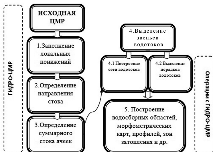
Рис. 1. Алгоритм построения гидрологически-корректной ЦМР и проведения гидрологических операций

Завершающим этапом будет служить автоматизированное выделение водосборных бассейнов. Однако для этого в ArcGIS необходимо обозначение «точек устьев» – мест впадения одного водотока в другой. К сожалению, в данном программном комплексе такая операция проводится вручную с помощью инструмента «Snap Pour Point». Он используется для выбора точек с максимальным суммарным стоком при построении водосборных