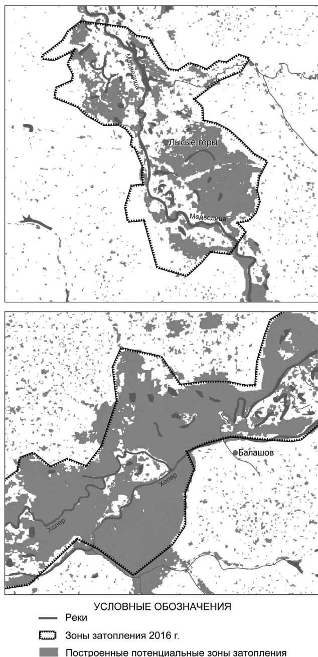
Рис.3. Фактические и смоделированные зоны затопления территории в пределах гидропостов Лысье горы и Балашов

Как отмечалось ранее, SRTM в формализованном виде является цифровой моделью мест-