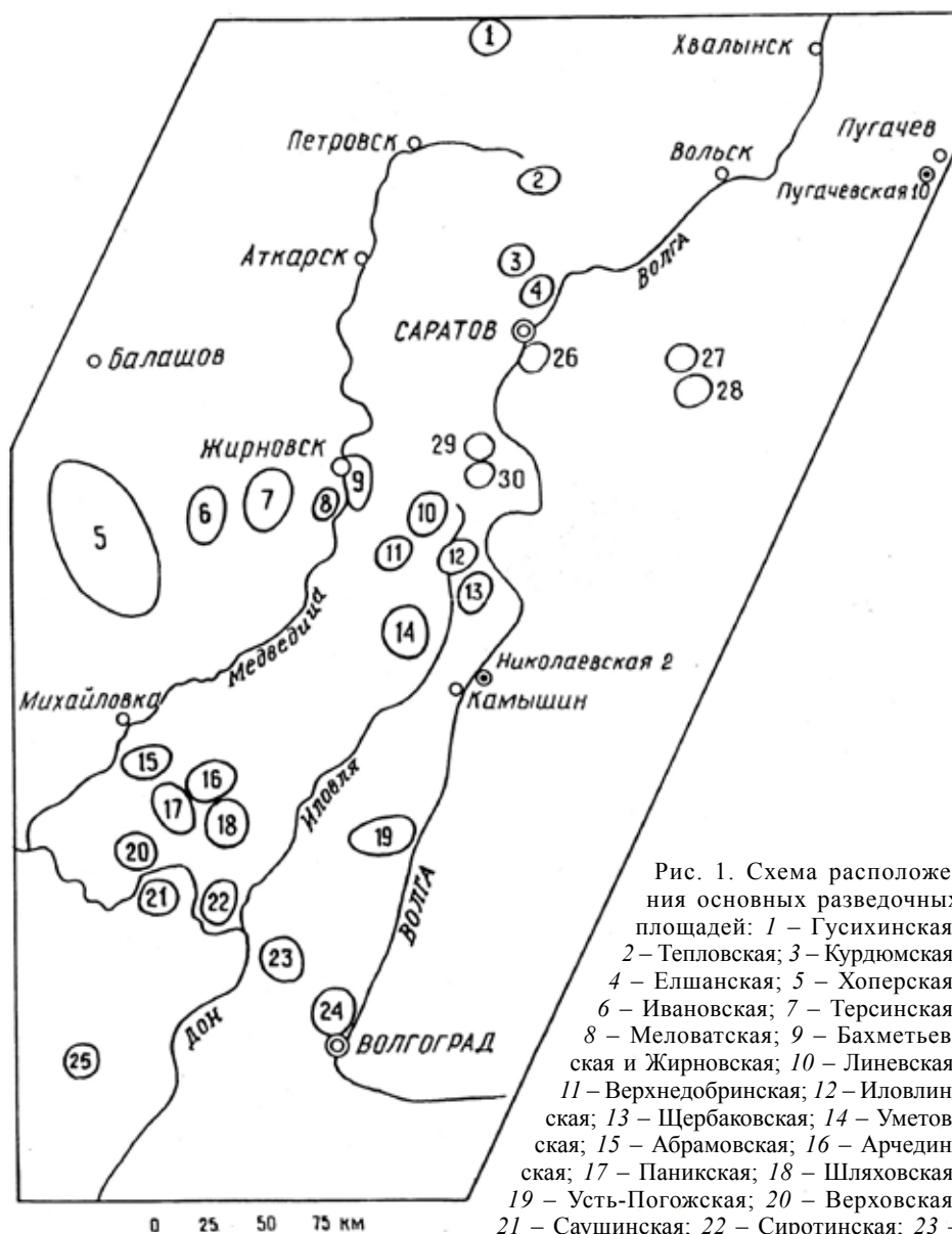
Рис. 1. Схема расположения основных разведочных площадей: 1 – Гусихинская; 2 – Тепловская; 3 – Курдюмская; 4 – Елшанская; 5 – Хоперская; 6 – Ивановская; 7 – Терсинская; 8 – Меловатская; 9 – Бахметьевская и Жирновская; 10 – Линеvская; 11 – Верхнедобринская; 12 – Иловлинская; 13 – Щербаковская; 14 – Уметовская; 15 – Абрамовская; 16 – Арчединская; 17 – Паникская; 18 – Шляховская; 19 – Усть-Погожская; 20 – Верховская; 21 – Саушинская; 22 – Сиротинская; 23 – Качалинская; 24 – Городищенская; 25 – Тормосинская; 26 – Квасниковская; 27 – Советская; 28 – Степновская; 29 – Красноармейская; 30 – Каменская; скважины Пугачевская 10 и Николаевская 2 показаны отдельными знаками

ными остатками. В ней обнаружены брахиоподы Choristites priscus (Eichw.), Ch. priscus var. senilis A. et Iv., пелециподы Carbonicola angulata Rich., Anthracomya sagitata Tschern., Najadites cf. carinata Sow. и обильные фораминиферы – Novella evoluta var. mosquensis Raus., Brunsiella ammodiscoides (Raus.), B. irregularis (Brazh. et Pot.), B. cf. densa Reitl., Eofusulina triangula (Raus. et Bel.), Schubertella ex gr. gracilis Raus.