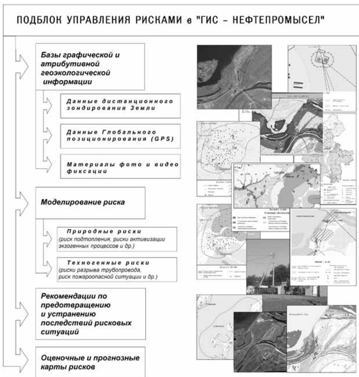
Рис. 2. Структура подблока «Управление рисками»