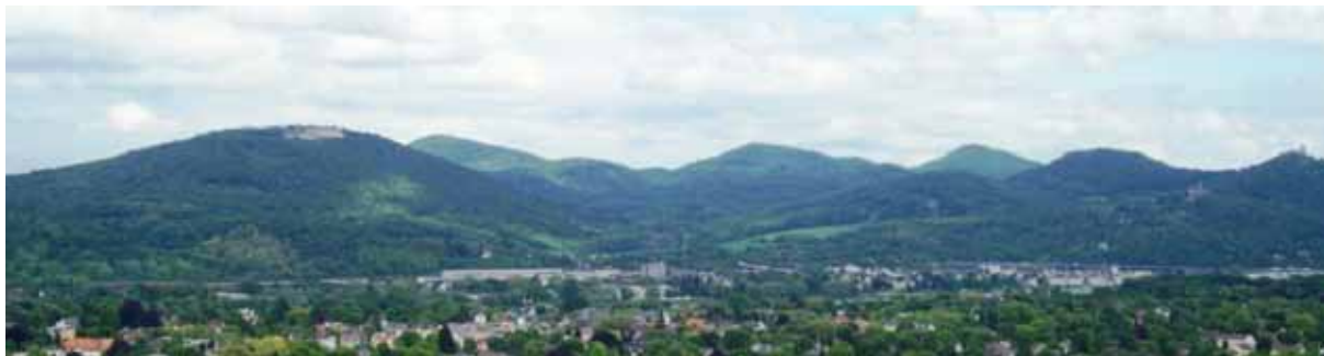
Рис. 1. Семигорье (2009 г.)

французами. Самой большой проблемой было приобретение стройматериала, который соответствовал бы как техническим, так и художественным потребностям. Альтернатив Драхенфельсу практически не имелось. Бургомистр близлежащего города Кёнигсвинтер Шефер, по совместительству совладелец участка, направил сообщение Королевскому правительству в Кельн и предложил объект для покупки. Правительство сочло 8 тыс. талеров слишком большой ценой. Тогда Шефер в 1827 г. продал гору профсоюзу каменотесов, обеспечив тем самым рабочими местами город и материалом стройку века [22]. Общественность пришла в возмущение, пресса бурлила. Из Берлинских газет король также узнал о творящемся на Рейне «вандализме». Уже через два дня наследный принц направил письмо верховному президенту фон Ингерслебену в Кобленц с просьбой «противодействовать бесчинствам разрушения таких исторических памятников, которые вызваны только корыстолюбием и жадной наживой» и заверениями, что в финансовом отношении в покупке Драхенфельса готова участвовать семья Гогенцоллерн [23, с. 59]. Отдельно король Фридрих Вильгельм III запросил справку у Кёльского начальника окружного управления Делиуса, который считал, что даже если Шефер хотел бы оставить руину в неприкосновенности, гарантией сохранности Драхенфельса на длительный срок может быть только покупка участка [23]. Пока шел обмен этой корреспонденцией, разработка горной породы бодро продвигалась.