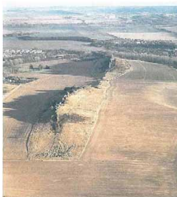
Рис. 2. Тойфельсмауэр [30, с. 5]

микrokлиматическими особенностями, и относящиеся к ней редкие виды флоры и фауны. На южной стороне у подножия уступа господствует микроклимат внутренних дюн. Скалы заселяются специфическими для сухих песчаных участков видами. На богатых питательными веществами навесных свежих лессовых почвах на северных склонах проявляется склонность к быстрому облесению пионерными древесными видами, такими как береза, полевой клен, лесной орех. На обрывистых склонах развились пустоши [31]. Рекреационное значение этого объекта приобрело особый вес после Второй мировой войны. В густо заселенных северных предгорьях Гарца, в первую очередь, в округах Кведлинбург и Тале, Тойфельсмауэр – общепризнанная цель посещения туристов и зона пригородного отдыха.