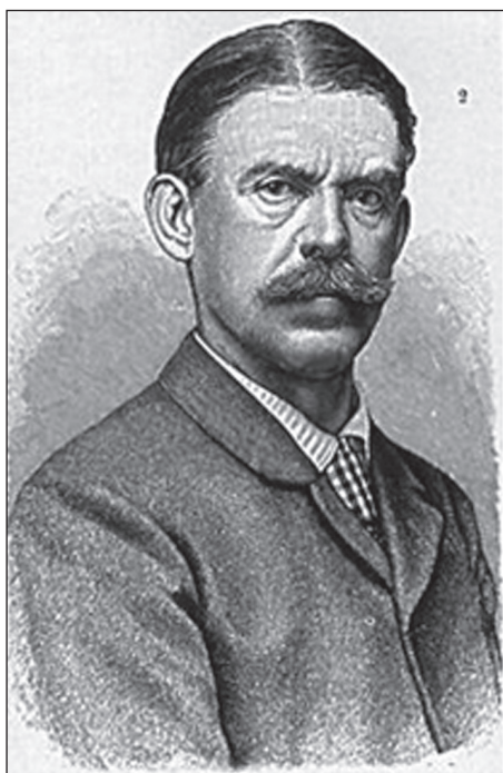
Рис. 3. Георг Швайнфурт

Тем самым, можно сказать, что в немецком языке и практике по охране природы до 1880 г. понятие «памятник природы» в теории закрепилось за уникальными деревьями, а также горами и скальными формациями. Связано это было не столько с