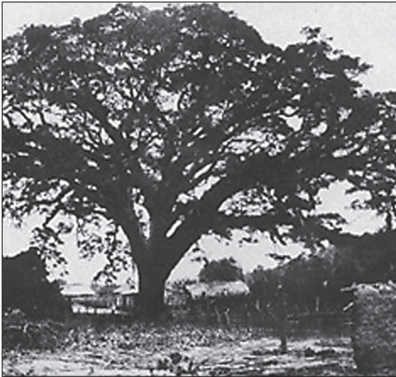
Рис. 1. Фотография дерева Samán del Guère венгерского путешественника Пале Рости (1857 г.)