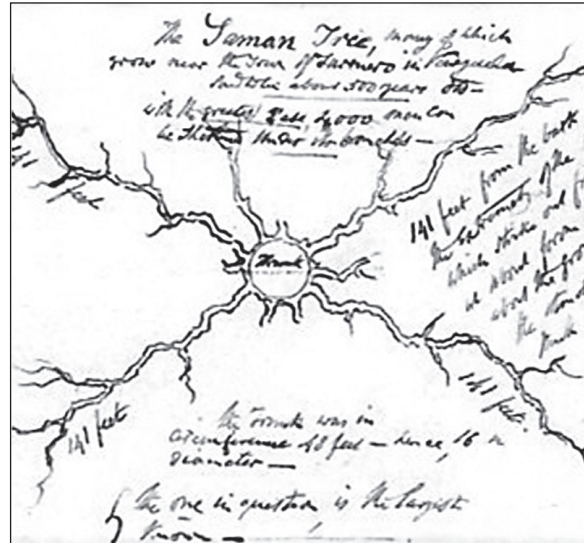
Рис. 2. План кроны дерева, сделанный британским дипломатом сэром Кёром Портером в 1829 г.

Третьей датой называют 1814 г. , видимо, по дате выхода в печать первого тома вышеупомянутой работы [9, 17, 18].