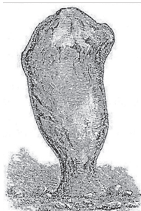
Рис. 4. Скала Абу-Одфа